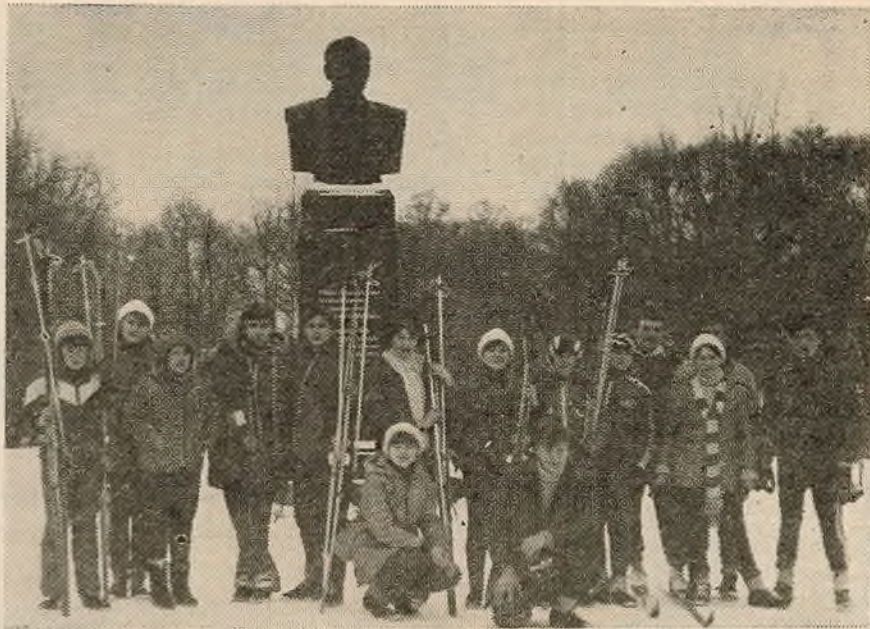
ГЭТЫЯ здымкі зроблены ў час зімовых каникулаў: студэнты першага курса факультэта журналістыкі ў двухдзённым паходзе на

— Аб ВДНГ я шмат чуў ад сяброў, і маё захапленне яшчэ больш вырасла, калі я пабываў у яе павілье-